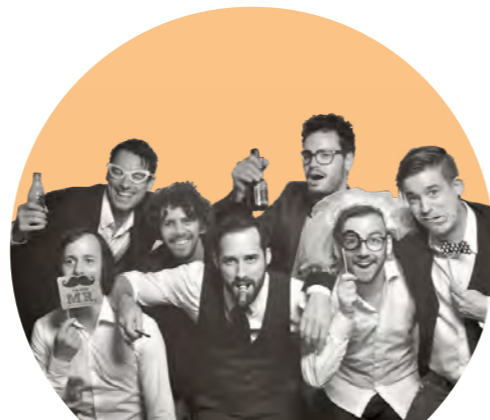
BAND Good Times